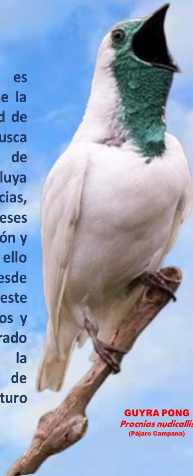
GUYRA PONG Procnias nudicallis (Pájaro Campana)

La Gaceta Universitaria es un mensuario en formato digital de la Dirección de Posgrado de la Facultad de Ingeniería Agronómica-UNE, que busca generar un nuevo espacio de participación académica, donde confluya toda la actualidad universitaria, noticias, información y diversos intereses vinculados a la docencia, la investigación y la extensión, impulsando con ello nuestro compromiso profesional desde esta Dirección. En consecuencia en este día muy especial para todos nosotros y desde la Dirección de Posgrado apostamos al compromiso por la consolidación de una Educación de Calidad para garantizar un futuro ambientalmente sostenible.